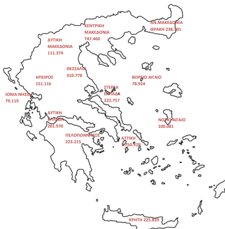
Χάρτης 1: Καταβολή Συντάξεων ανά Περιφέρεια

Στον Πίνακα 20 αποτυπώνονται τα ποσά σύνταξης που αντιστοιχούν σε κάθε Περιφέρεια σε σχέση με το αντίστοιχο ΑΕΠ για το έτος 2013 (προσωρινά στοιχεία ΕΛΣΤΑΤ). Σύμφωνα με τα δεδομένα του Πίνακα 20, στην Περιφέρεια Ηπείρου παρατηρείται η μεγαλύτερη τιμή (21,8%) του λόγου ποσού σύνταξης προς ΑΕΠ και ακολουθεί η Περιφέρεια Θεσσαλίας με τιμή 19,8%. Στην τελευταία θέση βρίσκεται η Περιφέρεια Νοτίου Αιγαίου με τιμή 10,2%.